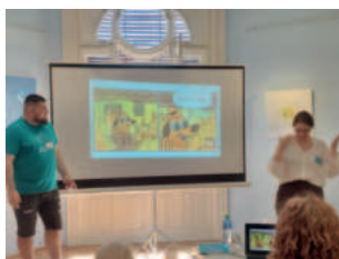
19. 6. 2024 Účast na podujatí Na 1 vlne, Žilina