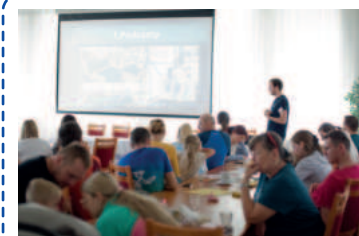
18. – 19. 10. 2024 AMKFEST 2024, Hruštín