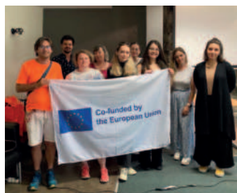
28. – 29. 6. 2024 Záver projektu o virtuálnej realite, Český Tešín