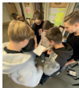
22. – 24. 11. 2024 3. fáza školenia Líder školského parlamentu, Terchová