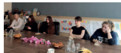
23. 3. 2024 Workshop aktívnej mládeže, Žilina