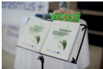
1. 4. 2024 Vytvorená Metodika udržateľnosti a rozvoja školských parlamentov