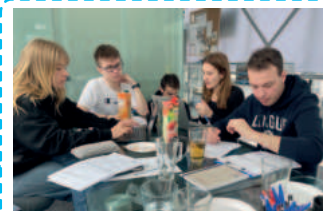
17. 2. 2024 Workshop aktívnej mládeže v Martine