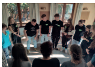
8. – 10. 11. 2024 Školenie nováčikov v školských parlamentoch II.