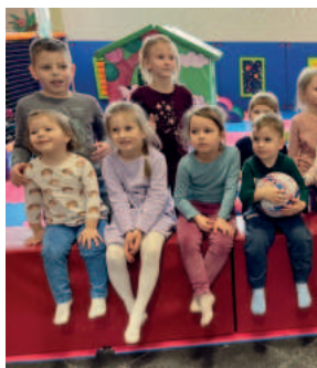
23. – 25. 2. 2024 Stretnutie mladých rodín s deťmi v Martine