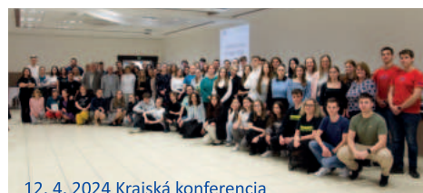
12. 4. 2024 Krajská konferencia školských parlamentov, Martin