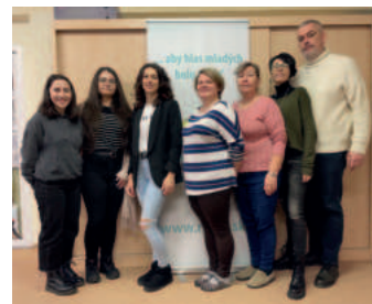
3. 2. 2024 Tvorba Metodiky pre školské parlamente