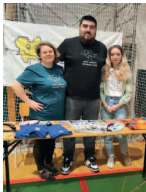
13. 9. 2024 Účast na festivale Medzi nami, Žilina