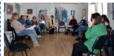
15. 3. 2024 Účasť na zasadaní komisie pre mládež pri Sekcii pre mládež ŽSK