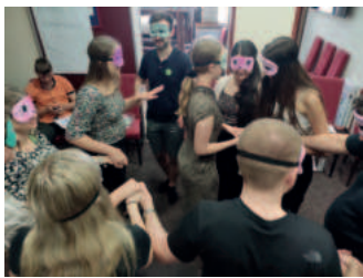
24. – 26. 5. 2024 3. fáza vzdelávania Lektor vzdelávacích aktivít, Martin