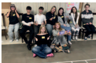
11. – 13. 10. 2024 Školenie nováčikov v školských parlamentoch I.