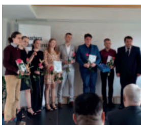
22. 3. 2024 Spoluorganizovanie oceňovania STOPA 2023