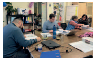
5. 2. 2024 Zasadanie Kontrolnej komisie RMŽK