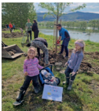
27. 4. 2024 Sadenie adoptovaného stromu na brehu Oravskej Priehrady