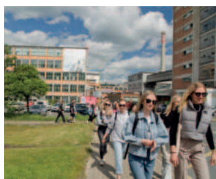
16. 5. 2024 Cesta za podnikaním, Zlín