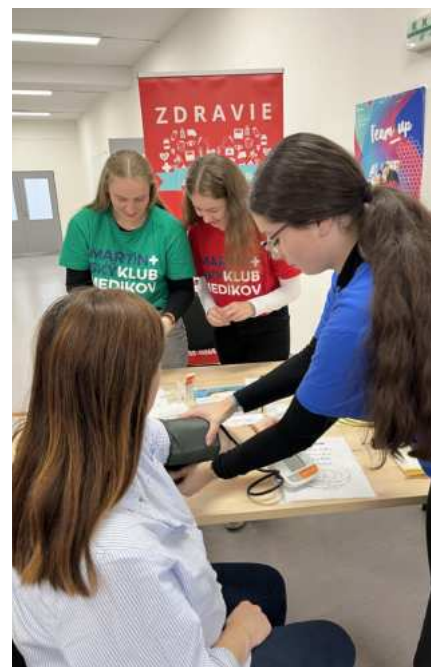
FOTO Martinský klub medikov