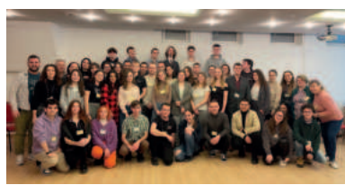
19. – 20. 1. 2024 Burza školských parlamentov v Trnave