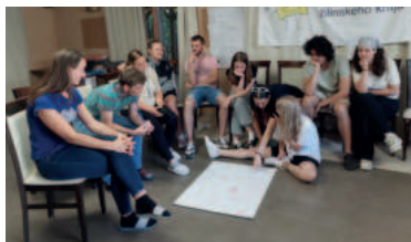
7. – 9. 6. 2024 Školenie aktívnej mládeže, Terchová