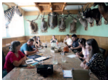
28. – 29. 8. 2024 Pracovná porada tímu RMŽK, Stráža