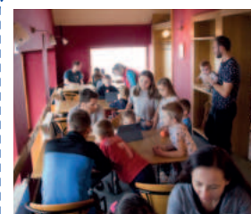
6. – 8. 12. 2024 Pobyt rodín zameraný na rozvoj digitálnych kompetencií detí, Terchová