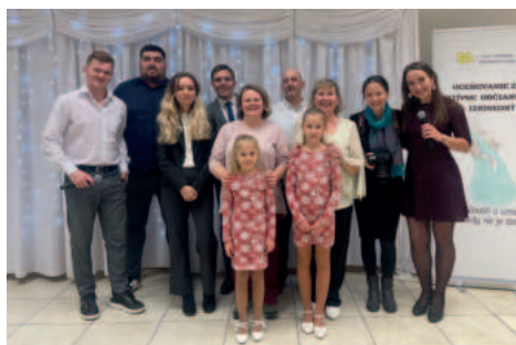
29. 11. 2024 Oceňovanie za aktívne občianstvo a ľudskosť 2024, Martin