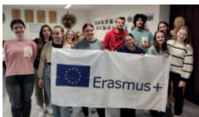
16. 3. 2024 Workshop aktívnej mládeže v Hruštíne