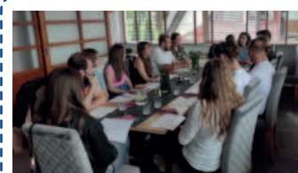
14. 6. 2024 Workshop aktívnej mládeže v Námestove