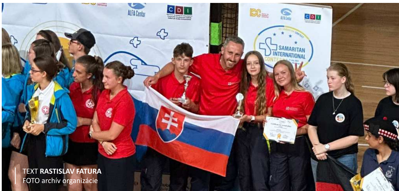
TEXT RASTISLAV FATURA