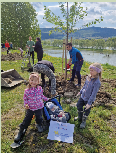
TEXT RMŽK

Na brehu Oravskej priehrady sme zasadili 27. 4. 2024 strom - čerešňu, ktorú sme adoptovali.