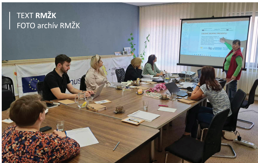
TEXT RMŽK FOTO archív RMŽK

7. 5. 2024 sme koordinovali prvé medzinárodné stretnutie, kde sme spolu otvorili nový medzinárodný projekt: Cesta mladých k zamestnaniu. Predstavili sme si aktivity projektu. Dohodli sme zodpovednosti a časový harmonogram.