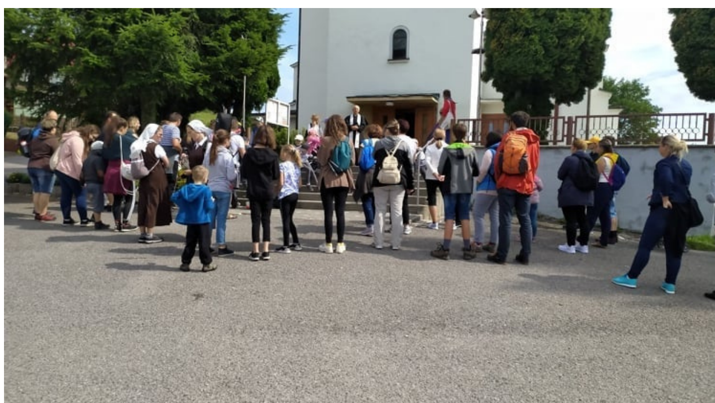
Spoločne sme putovali do Krivej so svojimi rodinami.