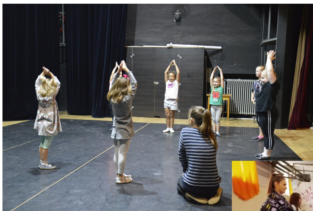
Pohybové aktivity pre malých aj veľkých